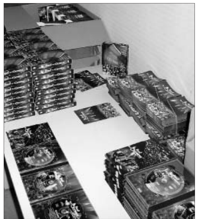
10 000 coffrets, réalisés par Trans Media Vision, seront à disposition dès dimanche chez Virgin.