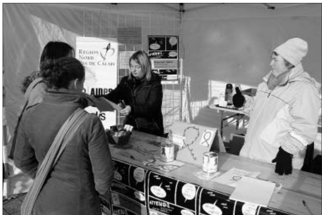
Hier, place Jean-Bart, plusieurs associations étaient présentes afin d'accueillir et informer les jeunes et les autres.

Centre de prévention santé, 4, rue Monsieur-Marquis, à Dunkerque (03 28 24 04 00). Ouvert le lundi de 17 h à 19 h, le mercredi de 13 h 30 à 17 h, le jeudi de 16 h à 19 h, et le vendredi de 13 h à 15 h.