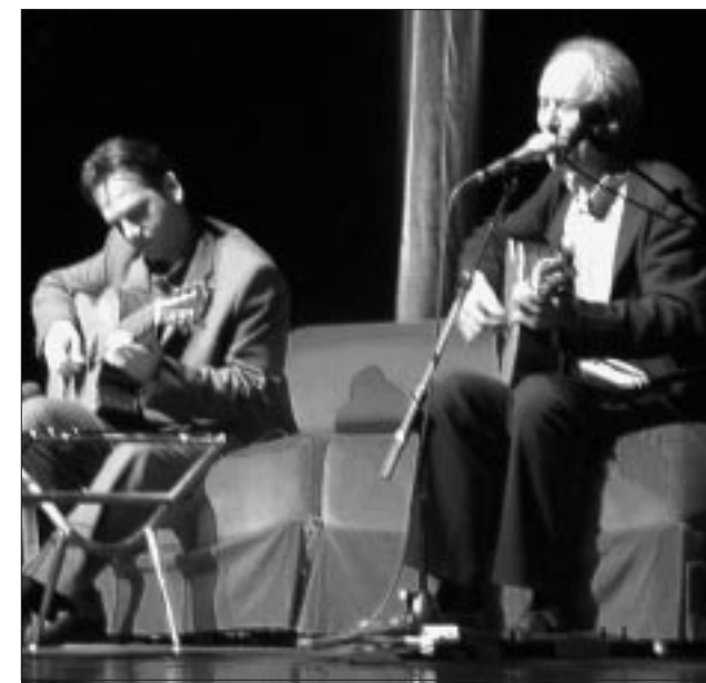
Assisté de Jean-Félix Lalanne, Maxime Le Forestier a offert deux heures de poésie acoustique au Kursaal.

Guitares acoustiques, voix enchanteresse, Maxime Le Forestier a fait un passage remarqué mercredi soir au Kursaal. La lumière rouge se met au diapason de la chaleur de l'accueil réservé à l'artiste. Rouge comme la canapé sur lequel les musiciens s'assoient, recevant le public dans leur salon.