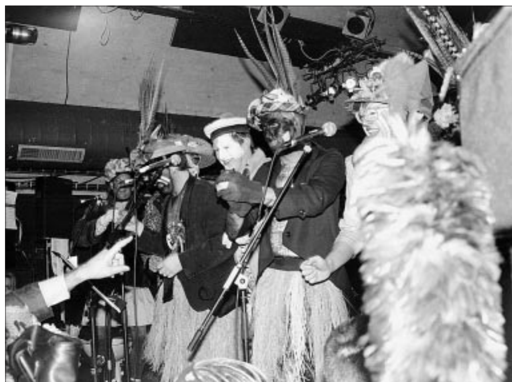
Les Prout en concert aux Quatre-Ecluses. Pour arriver jusqu'à eux, il fallait franchir des rangs compacts de carnavalesux. Un bras venu du bout de la salle montre le chemin à suivre.

l'heure du crime, juste le moment de s'amuser encore un peu plus. A vrai dire, on n'a pas eu besoin de beaucoup encourager les carnavalesux.